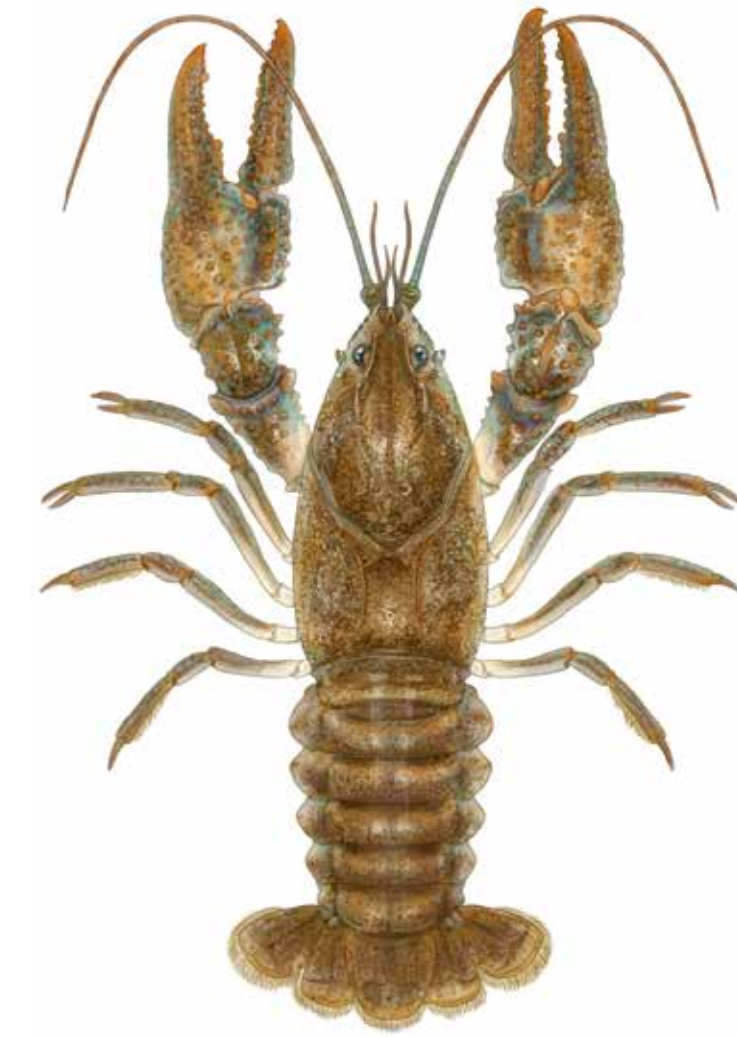
Écrevisse des torrents