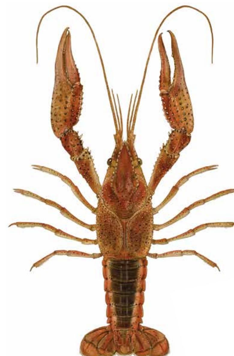
Écrevisse de la rivière Blanche