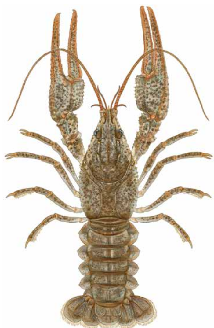
Écrevisse à pattes grêles