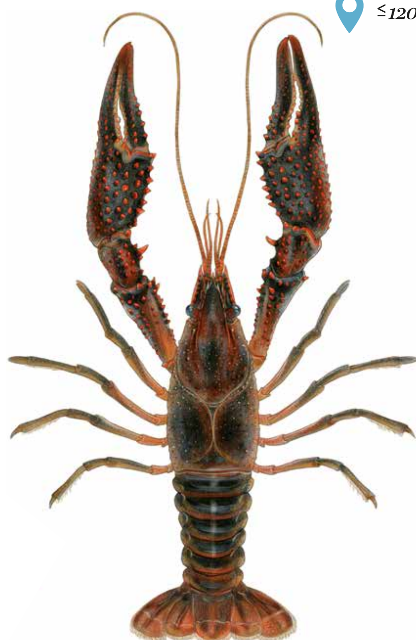
Écrevisse de Louisiane