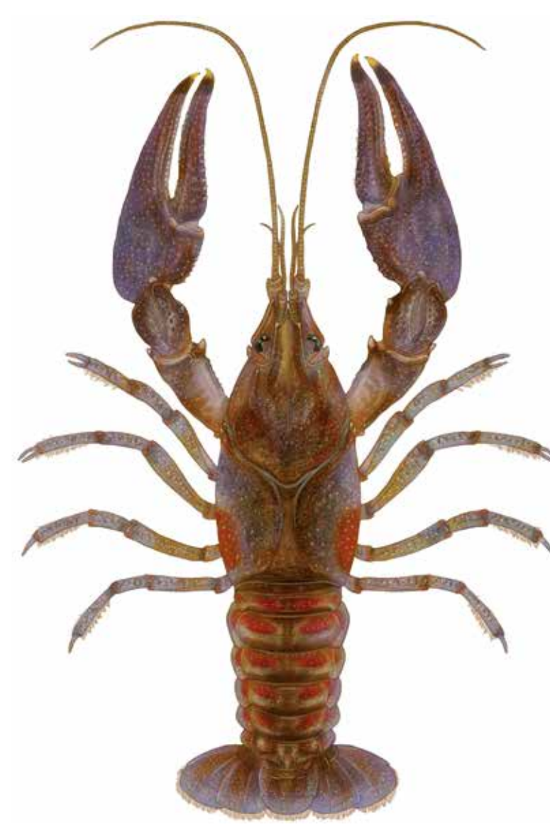
Écrevisse à taches rouges