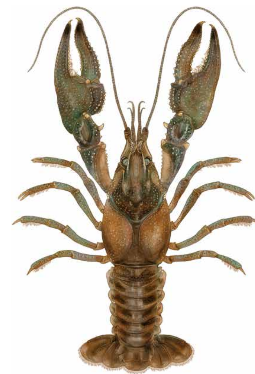
Écrevisse à pinces bleues