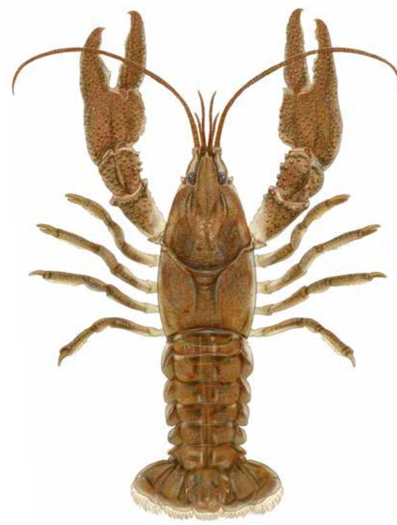
Écrevisse à pattes blanches