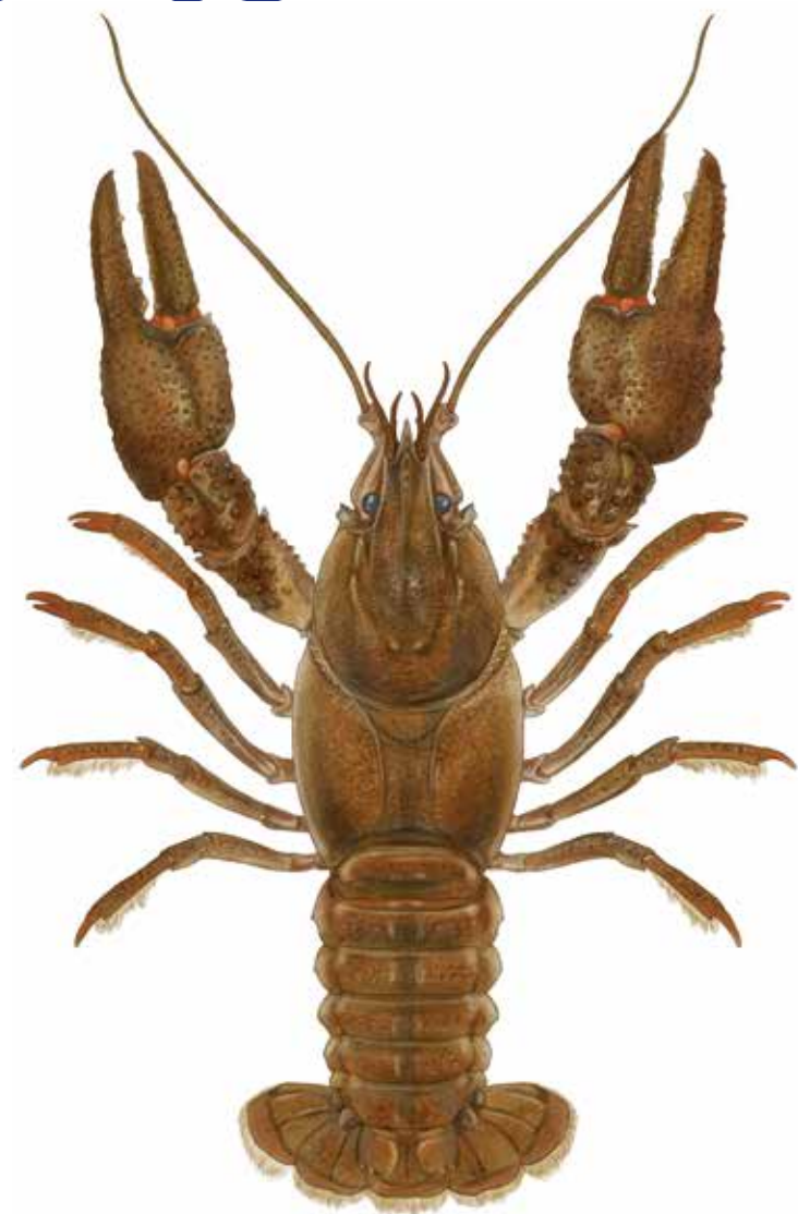
Écrevisse à pattes rouges