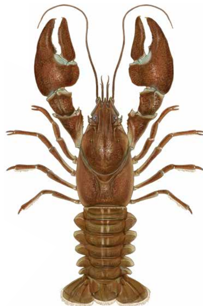
Écrevisse du Pacifique