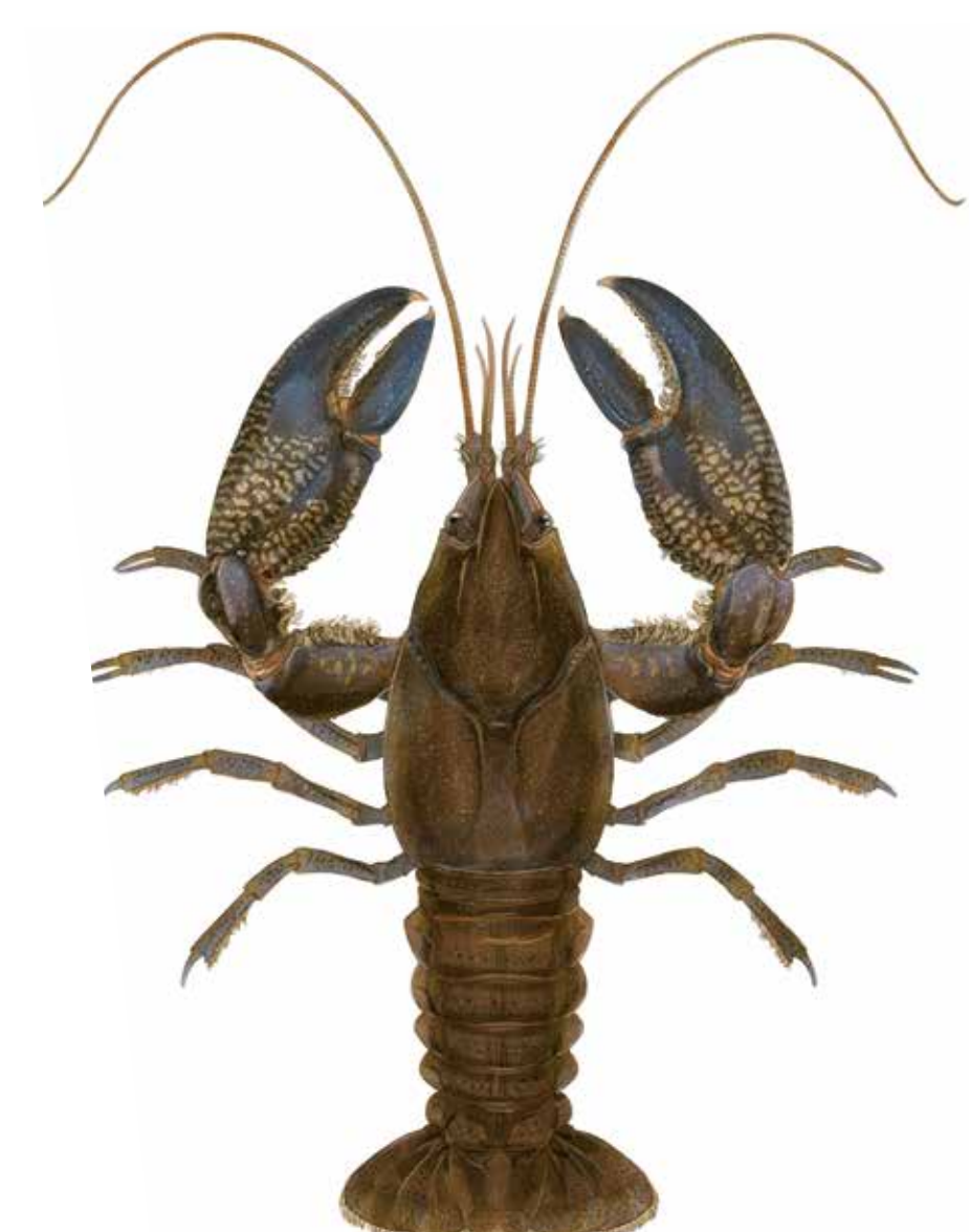
Écrevisse de Murray